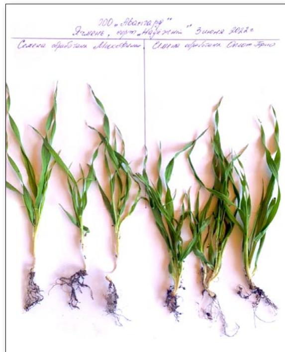
Фото 3. Растительные пробы ярового ячменя

Все аргументы в пользу МиксФила отразились на конечном результате – прибавка урожая по сравнению с участком, где использовался другой протравитель, составила почти 10 ц/га (фото 4).