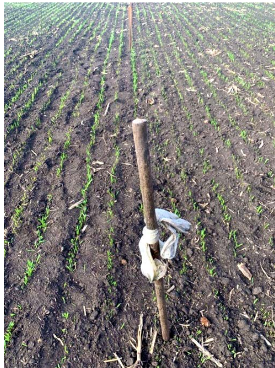
Фото 1, 2. Прорастание яровой пшеницы (обработанные МиксФилом растения слева от метки)